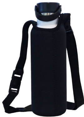
Fodera in neoprene